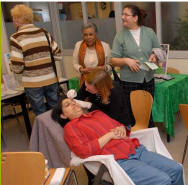
Even ontspannen bij de schoonheidsspecialist.

Op 28 januari 2009 vond een ouderenmarkt plaats voor alle ouderen die in Poelenburg wonen.